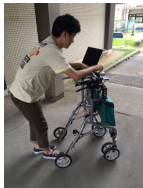
利用者とロボット